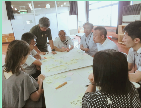
昨年度の研修会の様子から