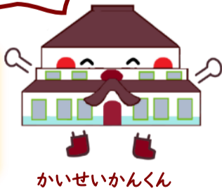
かいせいかんくん

会 場 郡山市開成館 開館時間 午前10時～午後5時（午後4時30分までに入館） 主 催 公益財団法人郡山市文化・学び振興公社（郡山市開成館）