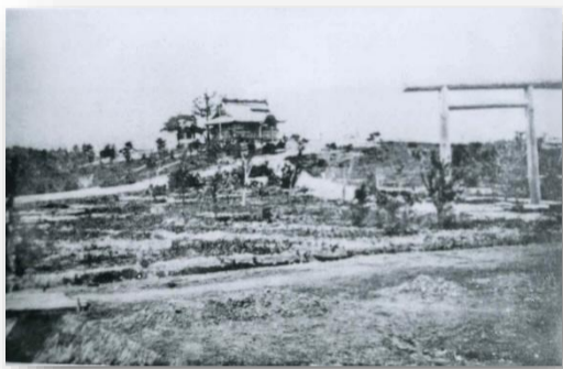
創建当初の開成山大神宮