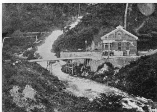
かつての沼上発電所