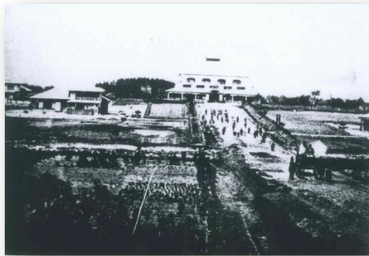
明治9年頃の開成館